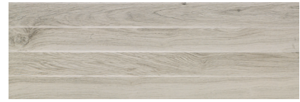
PB STEP GRIS RECT. 30 X 90 / 12" X 36"