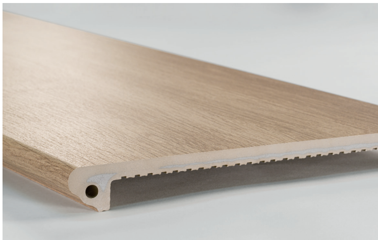
PELDAÑO FIOR. OREGON