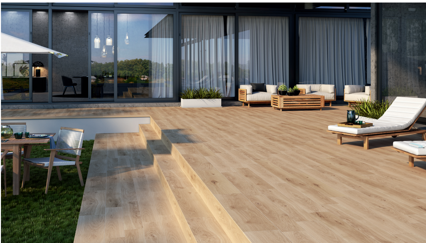
ANTI-SLIP OREGÓN NOGAL RECT 20X120.