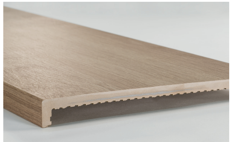
PELDAÑO RECTO ANT. OREGON