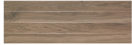
PB STEP ROBLE RECT. 30 X 90 / 12" X 36"