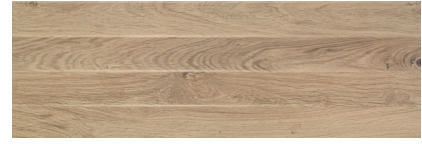
PB STEP NOGAL RECT. 30 X 90 / 12" X 36"