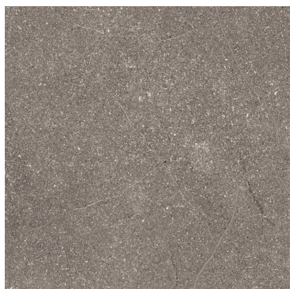
NAGARA BROWN F4545LB