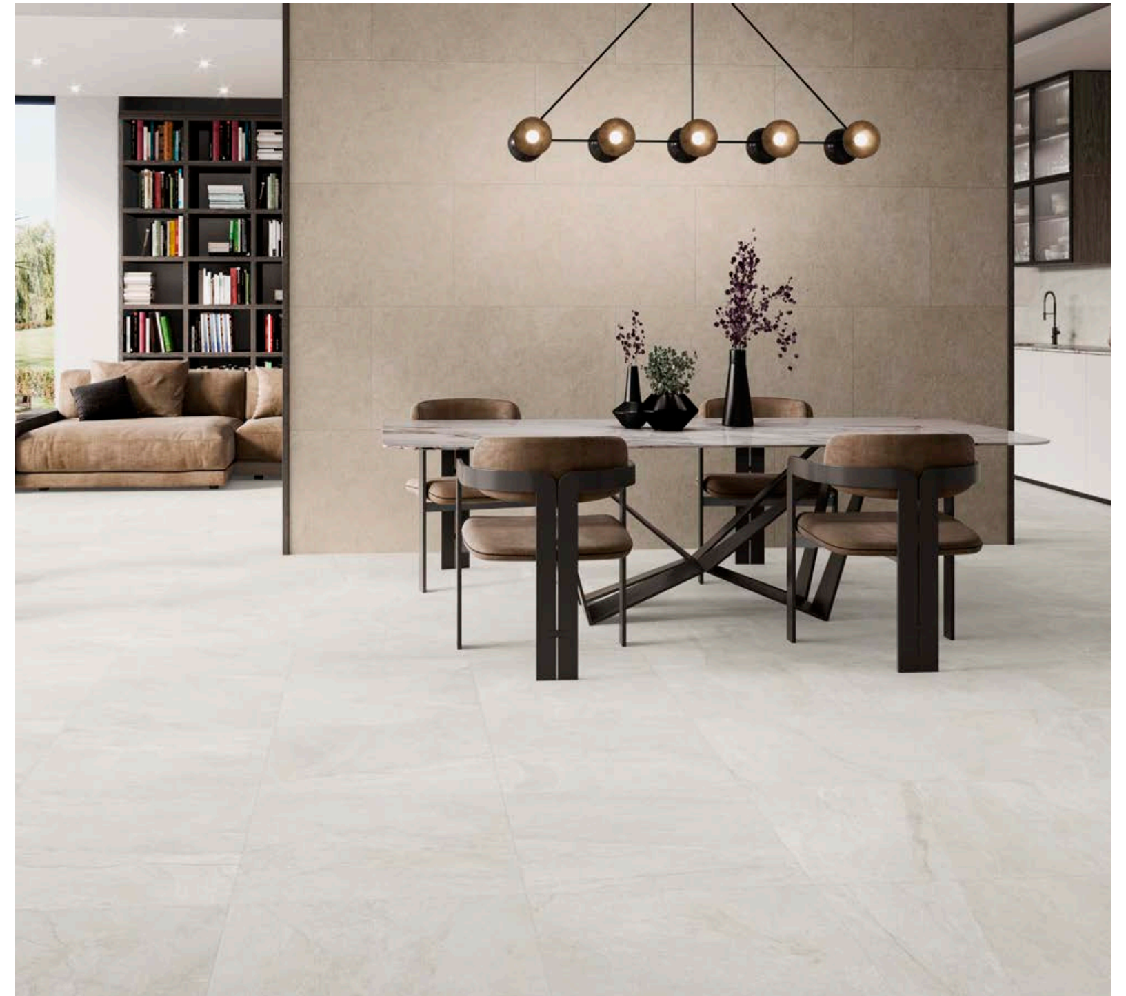
Wells M. Sand 60x60 Decorstone - Cromat Marfil 60x120 Semipulido

“Una danza de fríos y cálidos, hacen de esta serie una propuesta única y perfecta para todo tipo de ambientes y estilos”.