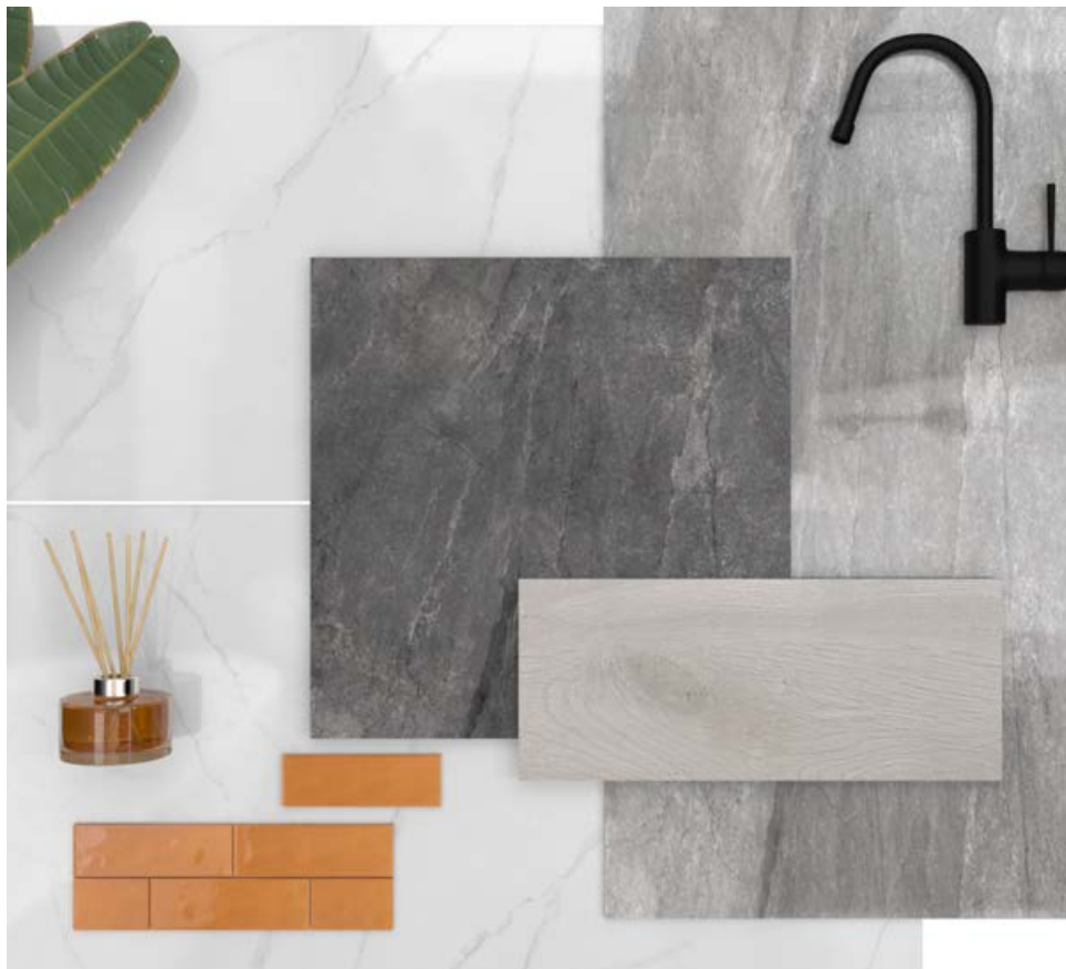
Moodboard: Wells Pearl Leviglass, Wells M. Ash Decorstone, Lincoln White Leviglass, Oldmanor Nacar, Mayfair Ocre