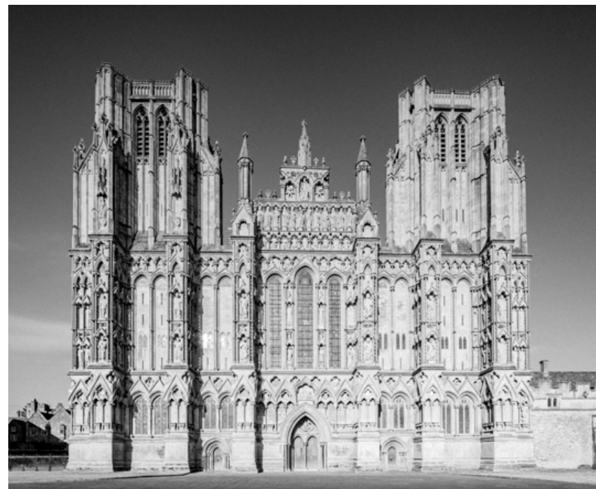
Catedral de Wells | Wells Cathedral | Cathédrale de Wells

En Bath célèbre est sans aucun doute la cathédrale de Wells, la première à avoir été conçue et construite dans le style gothique à partir de 1175 le sud de l'Angleterre.