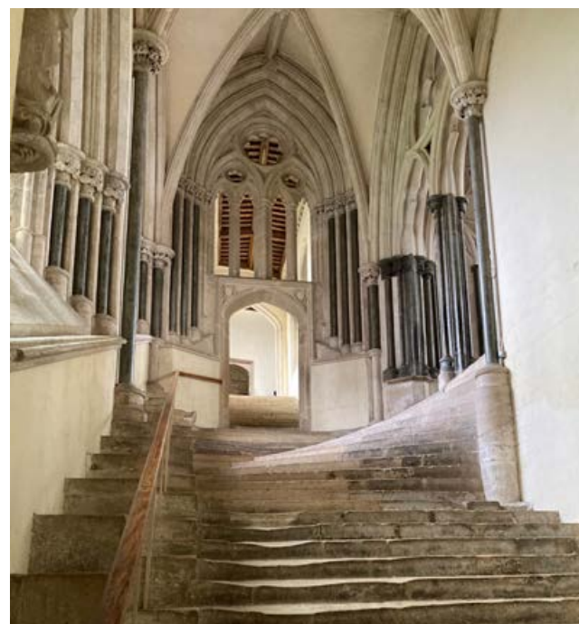
Catedral de Wells | Wells Cathedral | Cathédrale de Wells

Une danse de couleurs froides et chaudes font de cette série une proposition unique, parfaite pour tous les types d'environnements et de styles.