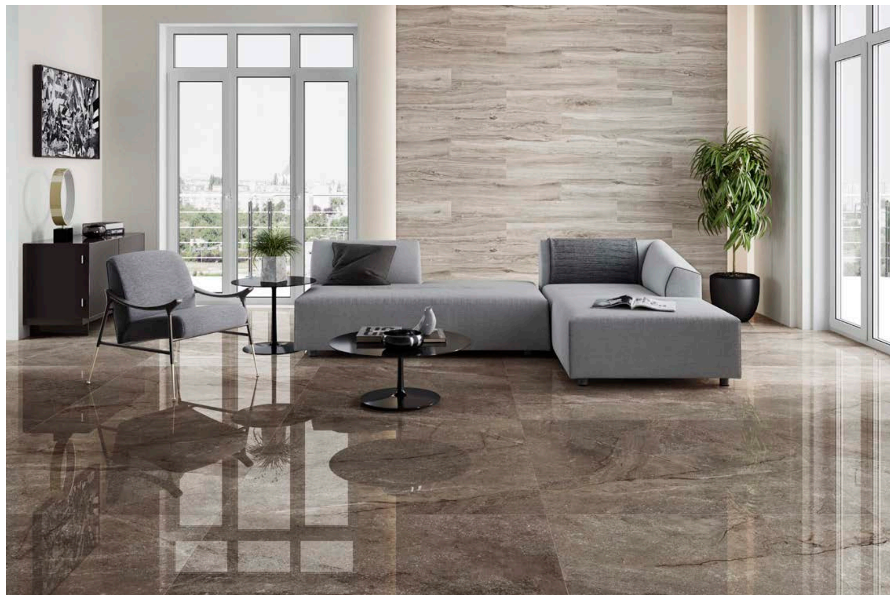
Wells Moka 120x120 Leviglass - Rovere Desert 25x150