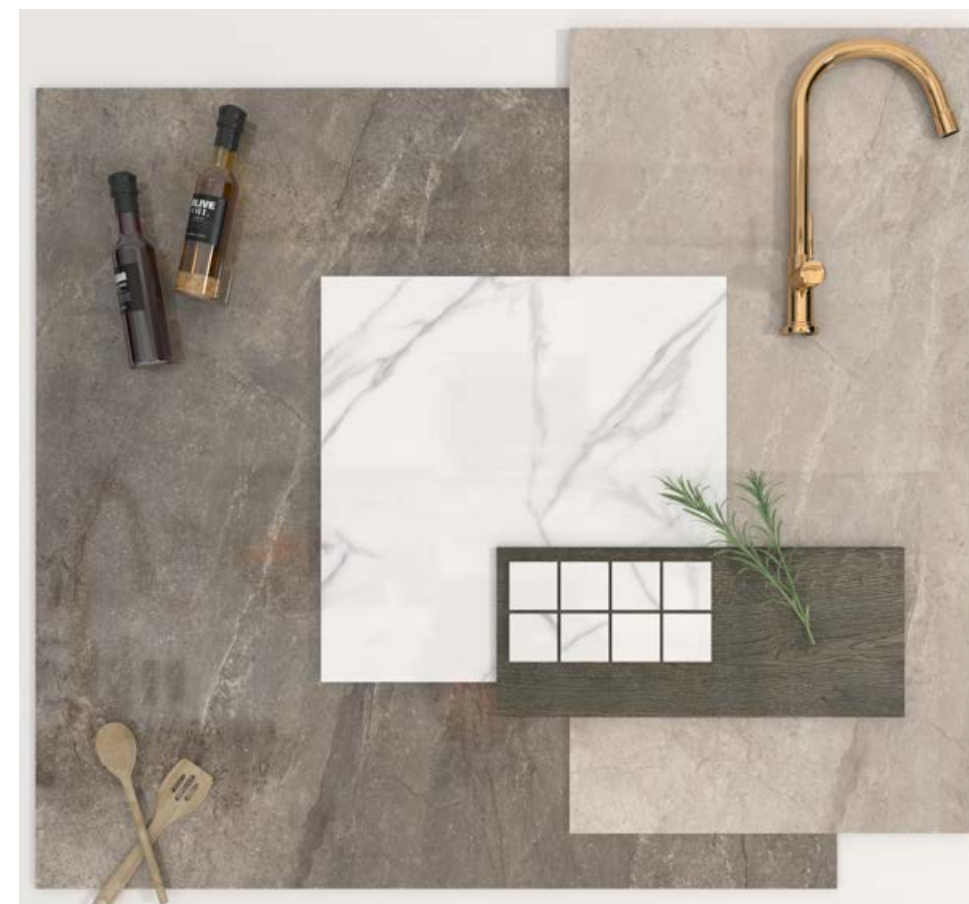
Moodboard: Wells Sand Leviglass, Wells Moka Leviglass, Lincoln Cream Leviglass, Malla Lincoln Cream Leviglass, Oldmanor Cuero

“Clásico color Moka, que nos recuerda al café tostado”