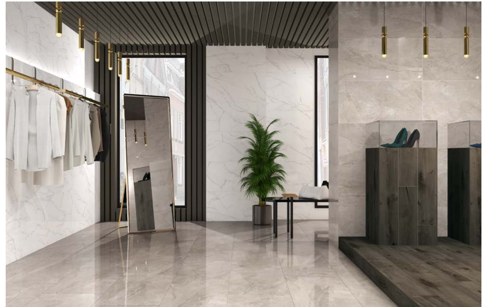
Wells Sand 60x120 Leviglass - Lincoln Cream 60x120 Leviglass