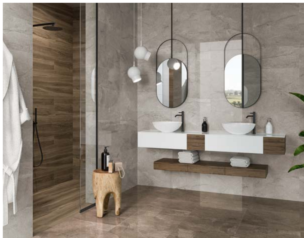
Wells Sand 30x60 -Wells Moka 60x60 Leviglass - Rovere Brown 25x150

“Una danza de fríos y cálidos, hacen de esta serie una propuesta única y perfecta para todo tipo de ambientes y estilos”.