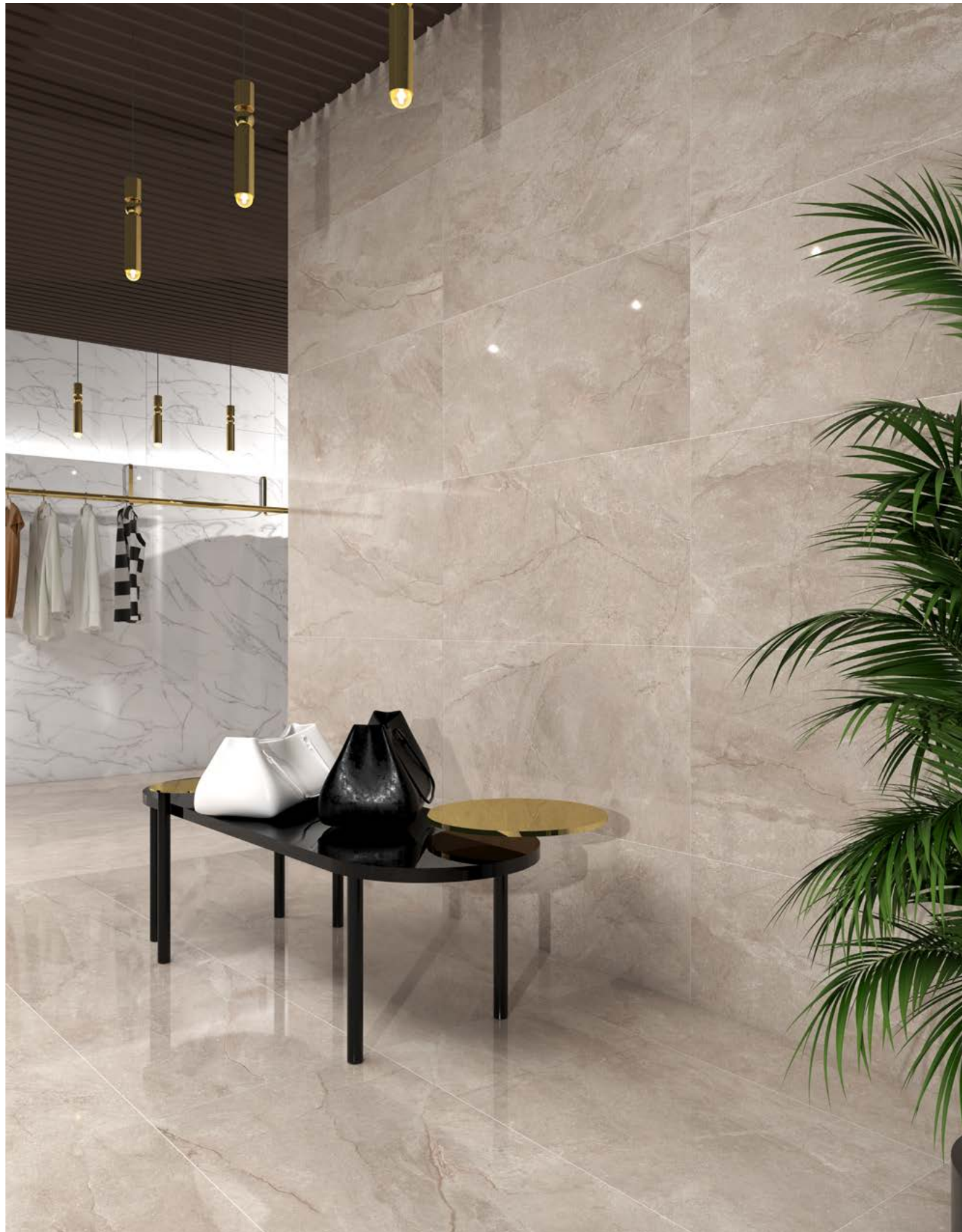
Wells Sand 60x120 Leviglass - Lincoln Cream 60x120 Leviglass