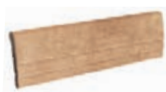
MOLDURA RECTA II DU-185372 310 x 86 x 15