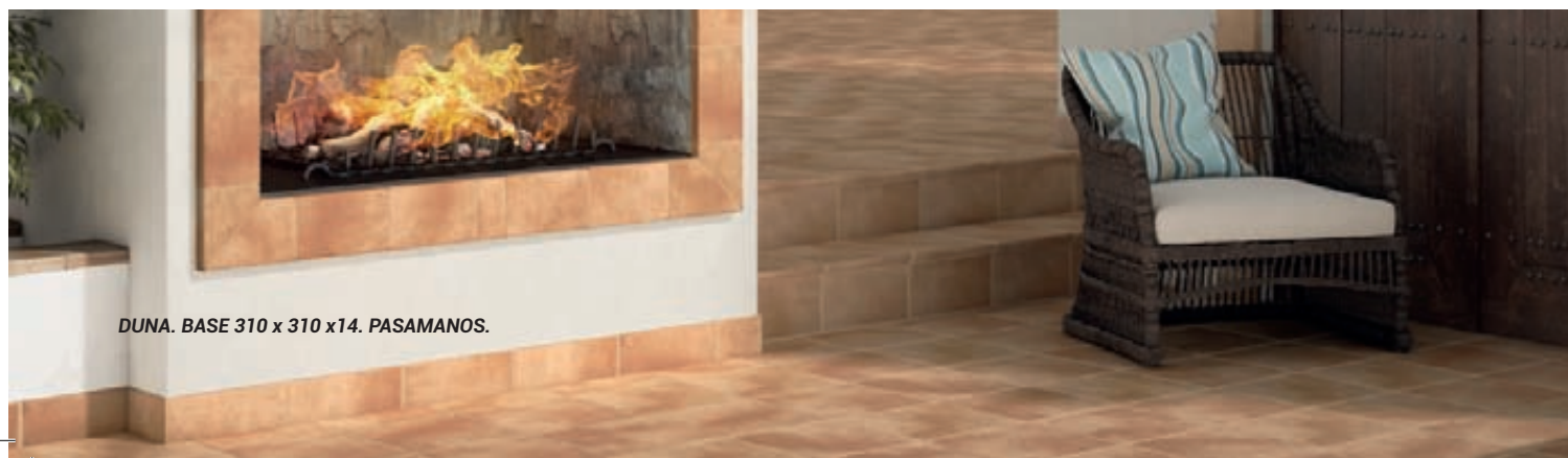
DUNA. BASE 310 x 310 x 14. PASAMANOS.