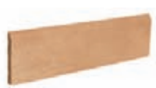
RODAPIÉ DU-040372 310 x 86 x 11