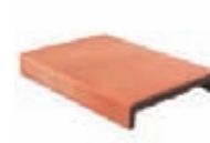
PASAMANOS DU-137372 245 x 150 (120 interior) x 33 DU-138372 245 x 190 (160 interior) x 33