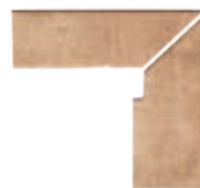
ZANQUÍN RECTO EVO DU-152372 Drcho. DU-153372 Izdo. 305 x 270 x 86