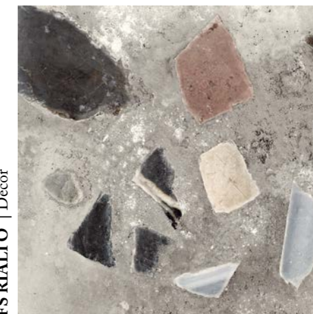
FS RIALTO | Decor