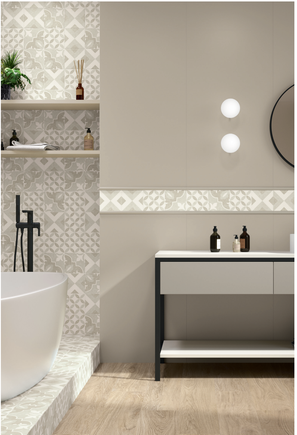
BRIANNA PUMICE 15X15 / NUANCES NATURAL RECT 20X120 / CHAMPAGNE MATT RECT 60X120