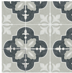
NORA COAL 15X15 / 6"X6"