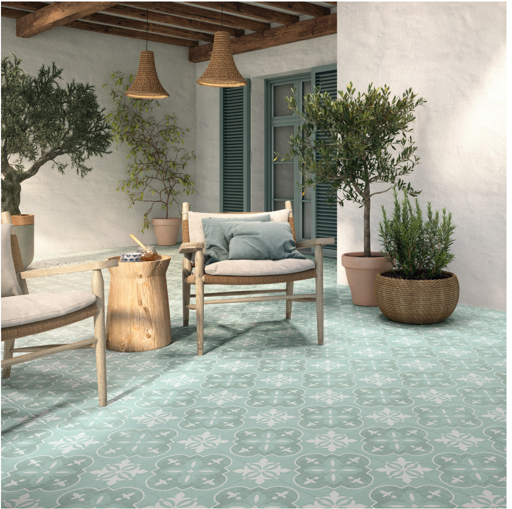
NORA ACQUA 15X15