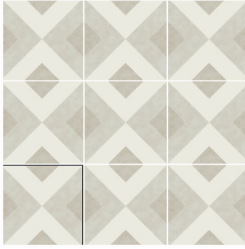
BRIANNA PUMICE 15X15 / 6"X6"