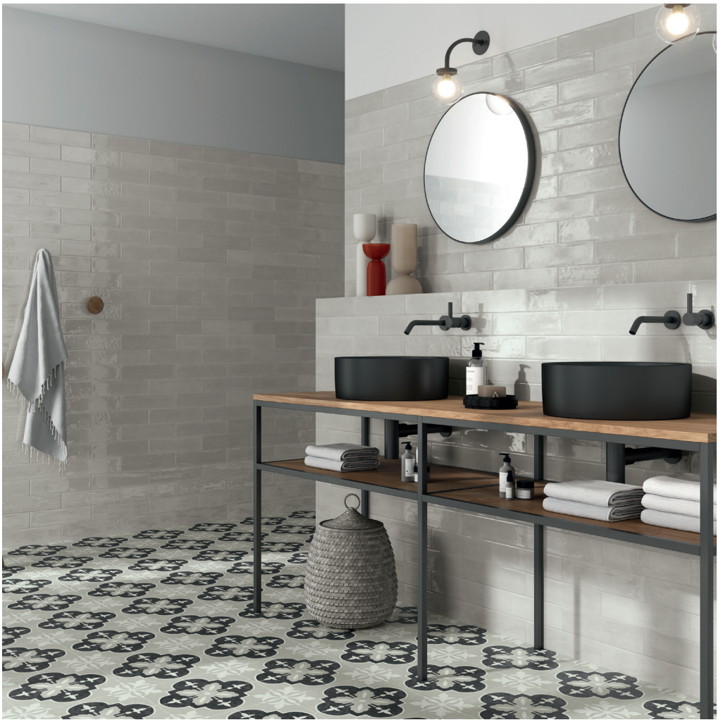
MUD GREY 7,5X30 / NORA COAL 15X15