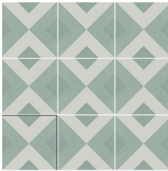
BRIANNA ACQUA 15X15 / 6"X6"