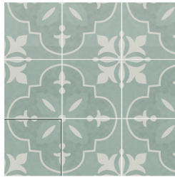
NORA ACQUA 15X15 / 6"X6"