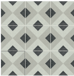
BRIANNA COAL 15X15 / 6"X6"