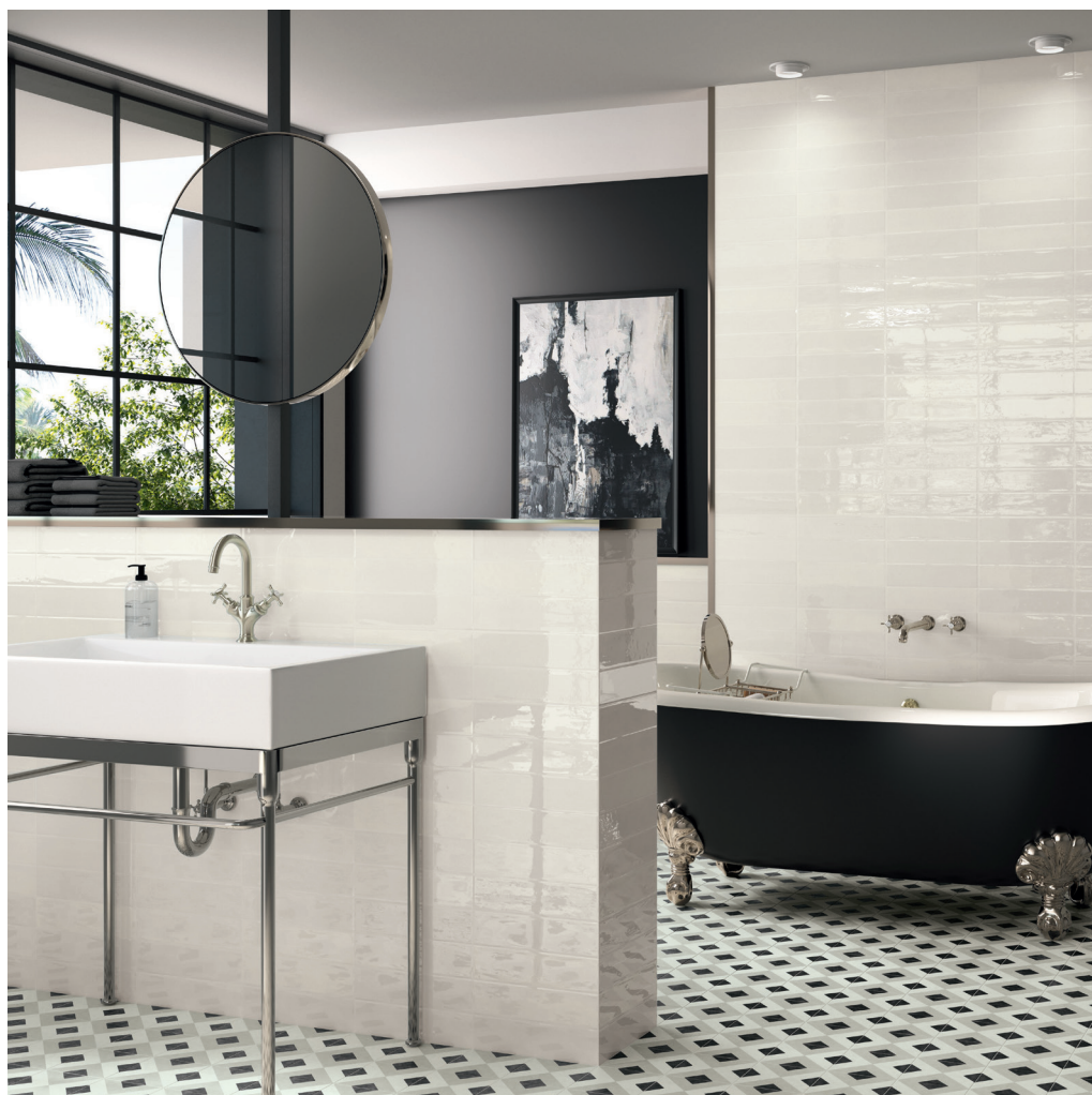
BRIANNA COAL 15X15 / MUD WHITE 7,5X30