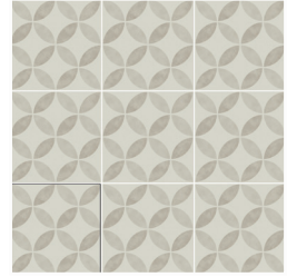
ENYA PUMICE 15X15 / 6"X6"