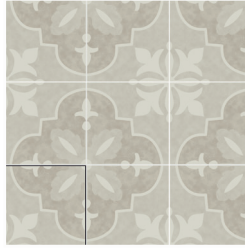
NORA PUMICE 15X15 / 6"X6"