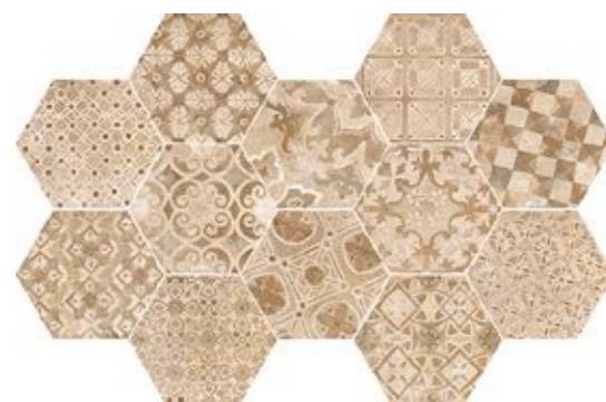
R55U Epoca Decoro Cementine Rosa*** 21x18,2

Abbinabile ai fondi / Matching with colours / Mit den Grundfliesen kombinierbar / Peut s'associer aux carreaux de base de couleurs / Puede combinarse con los fondos / Сочетается с фоновой плиткой: Cotto Scuro, Cotto Rosso