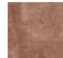
R54Y Epoca Cotto Rosso 30x30