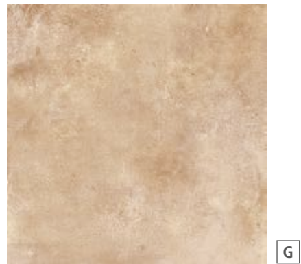
R02K Epoca Rosa rettificato 60x60