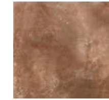
R54X Epoca Cotto Scuro 30x30