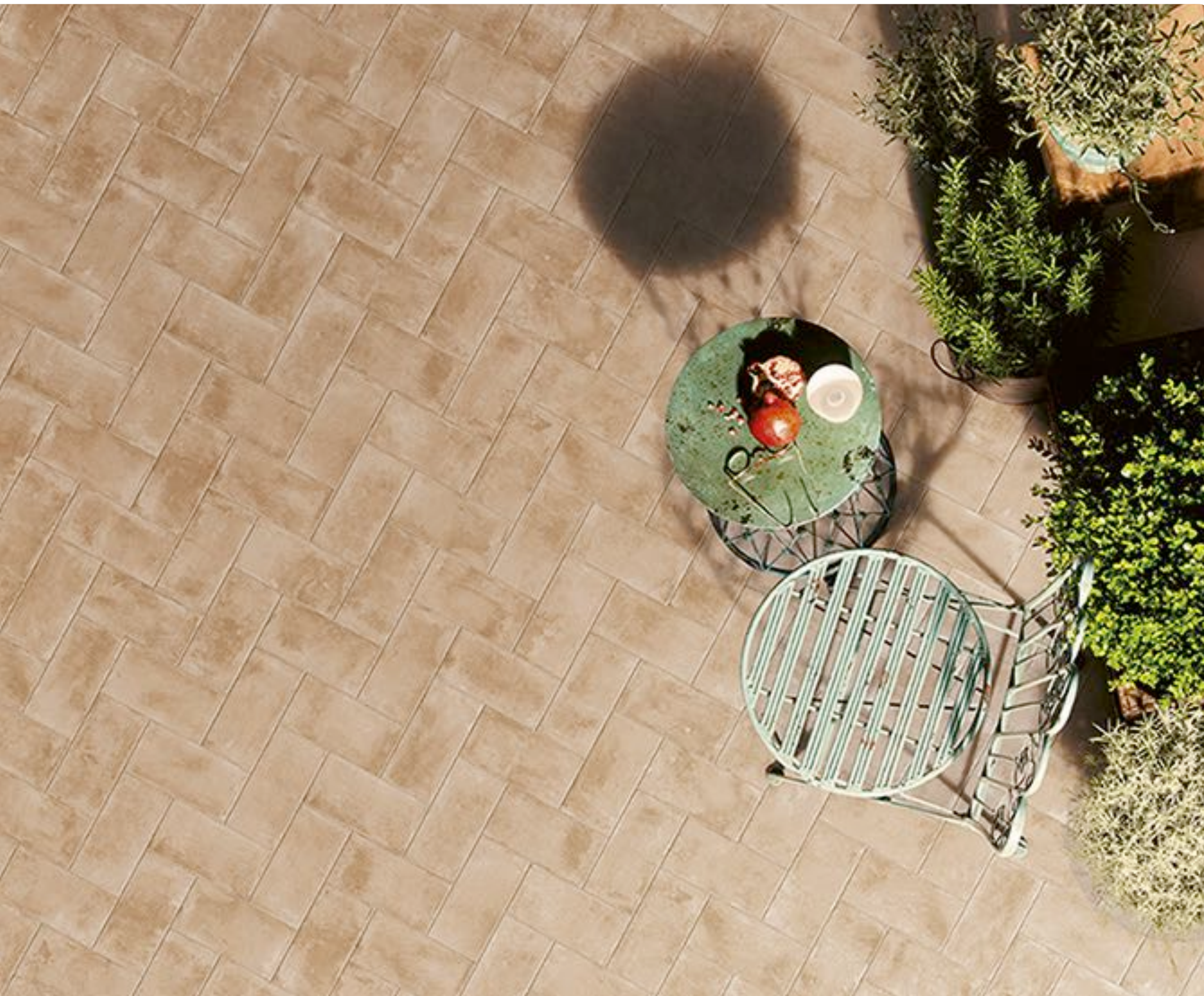
R55F Epoca Rosa Outdoor 15x30