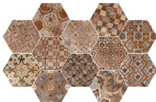
R55V Epoca Decoro Cementine Cotto Scuro*** 21x18,2

Abbinabile ai fondi / Matching with colours / Mit den Grundfliesen kombinierbar / Peut s'associer aux carreaux de base de couleurs / Puede combinarse con los fondos / Сочетается с фоновой плиткой: Cotto Scuro, Cotto Rosso