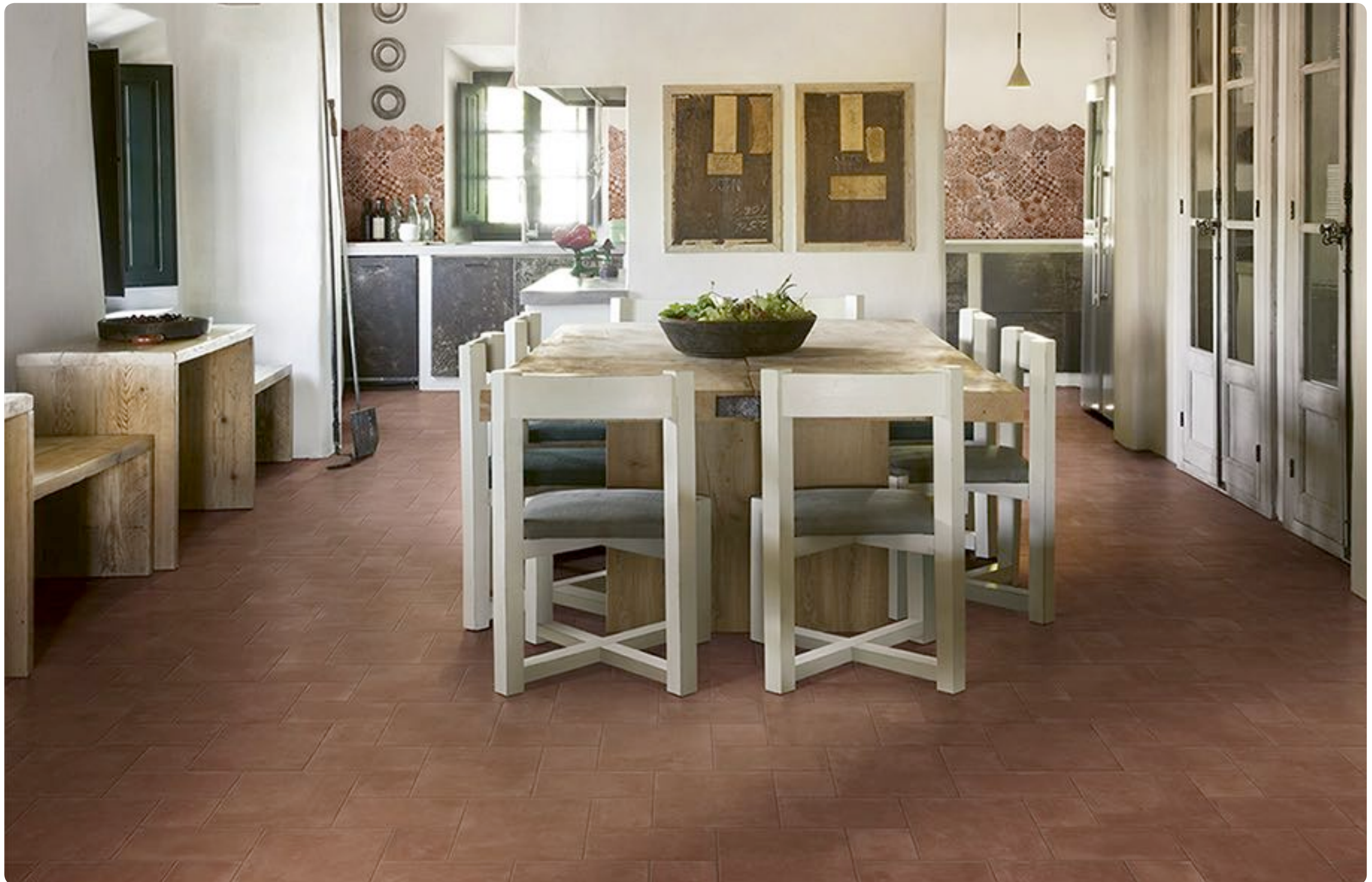
R55D Epoca Cotto Rosso 15x15