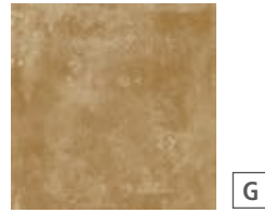
R54V Epoca Ocra 30x30