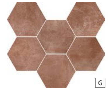
R55S Epoca Cotto Rosso 21x18,2