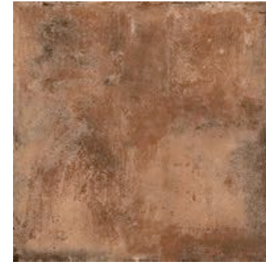
R02L Epoca Cotto Scuro rettificato 60x60