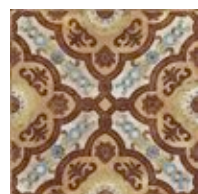
R03Q Epoca Decoro Tappeto Ocra 30x30

Abbinabile ai fondi / Matching with colours / Mit den Grundfliesen kombinierbar / Peut s'associer aux carreaux de base de couleurs / Puede combinarse con los fondos / Сочетается с фоновой плиткой: Ocra, Cotto Rosso