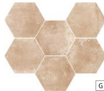
R55Q Epoca Rosa 21x18,2