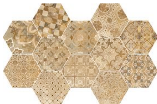
R55T Epoca Decoro Cementine Ocra*** 21x18,2