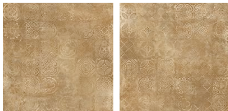
R03D Epoca Decoro Anticato Ocra rettificato** 60x60

Abbinabile ai fondi / Matching with colours / Mit den Grundfliesen kombinierbar / Peut s'associer aux carreaux de base de couleurs / Puede combinarse con los fondos / Сочетается с фоновой плиткой: Ocra, Cotto Rosso