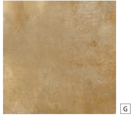
R02J Epoca Ocra rettificato 60x60