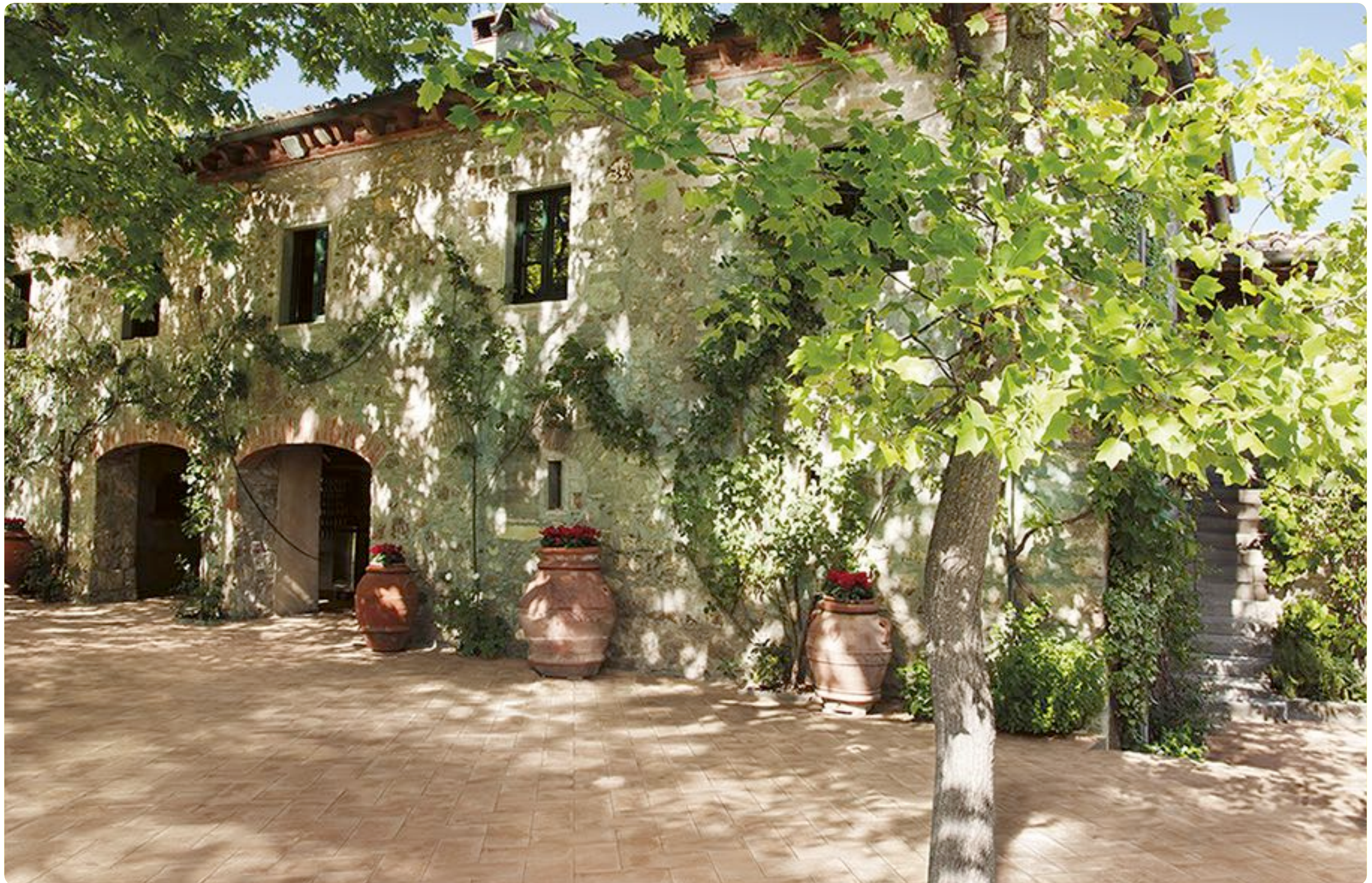
R55F Epoca Rosa Outdoor 15x30