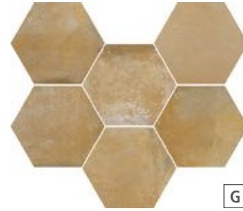
R55P Epoca Ocra 21x18,2