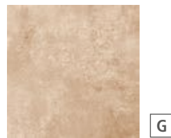
R54W Epoca Rosa 30x30