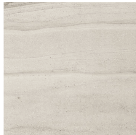
PEI 4 ● At. Santorini Perla 45x45 M06 001.302.0037.04582