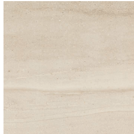
PEI 4 ● At. Santorini Arena 45x45 M06 001.302.0017.04582