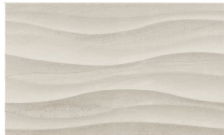
● At. Ond. Santorini Perla 33,3x55 M09 002.870.0037.04583