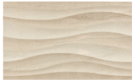
● At. Ond. Santorini Arena 33,3x55 M09 002.870.0017.04583