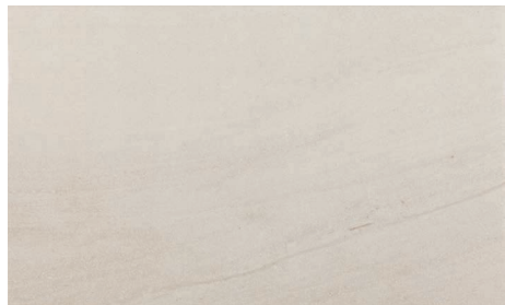
● At. Santorini Perla 33,3x55 M04 002.870.0037.04582