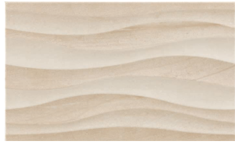
● At. Ond. Santorini Crema 33,3x55 M09 002.870.0096.04583