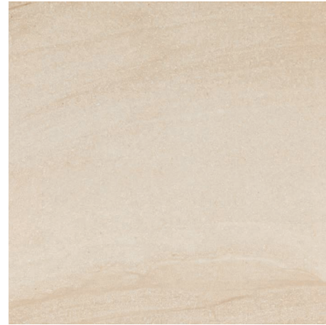
PEI 3 ● At. Santorini Crema 45x45 M06 001.302.0096.04582