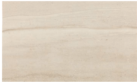
● At. Santorini Arena 33,3x55 M04 002.870.0017.04582