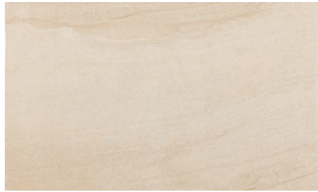
● At. Santorini Crema 33,3x55 M04 002.870.0096.04582