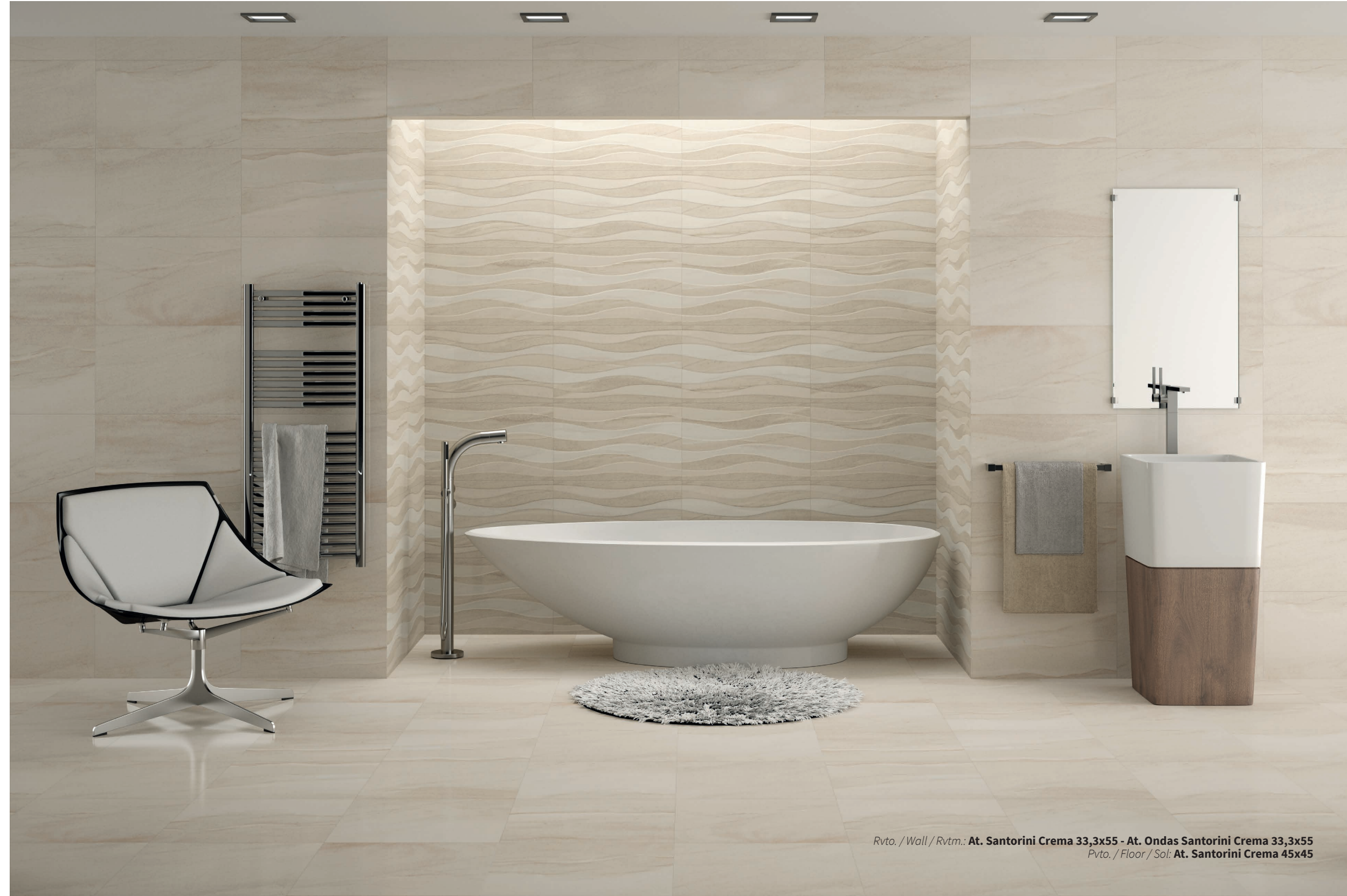
Rvto. / Wall / Rvrm.: At. Santorini Crema 33,3x55 - At. Ondas Santorini Crema 33,3x55 Pvto. / Floor / Sol: At. Santorini Crema 45x45