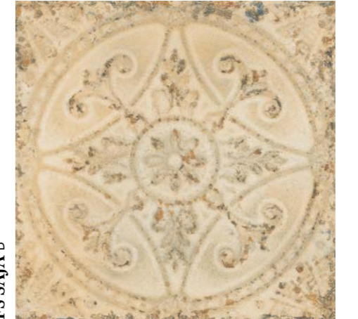
FS SAJA B