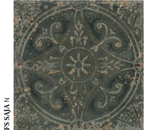
FS SAJA N