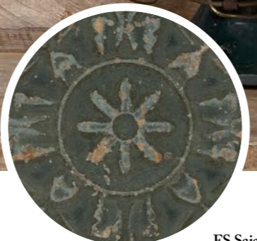
FS Saja N