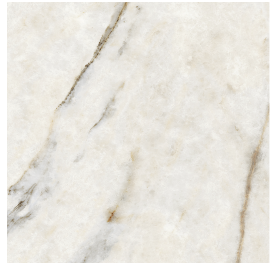
Prestige Natural Pul P440R