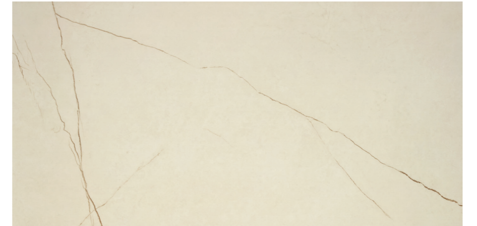
Imperiale Ivory Pul P460R