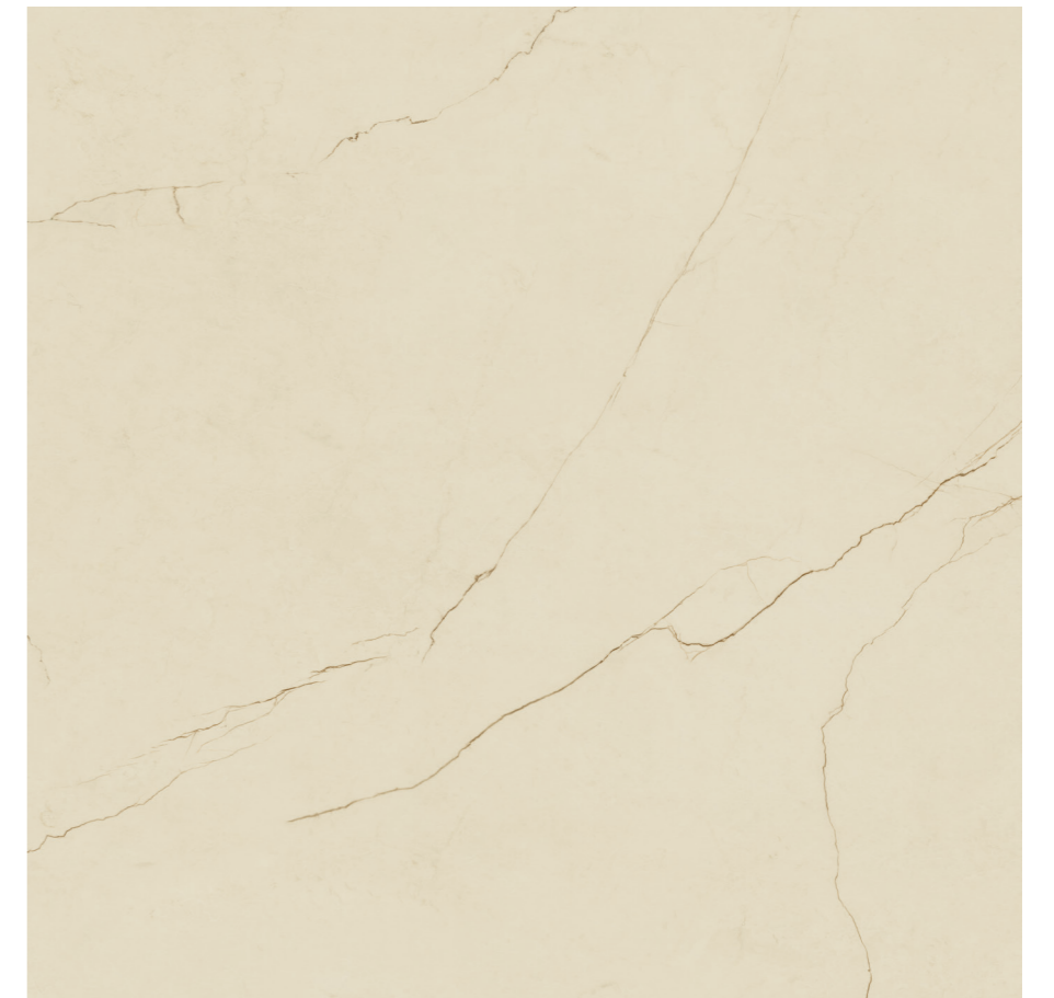
Imperiale Ivory Pul P440R