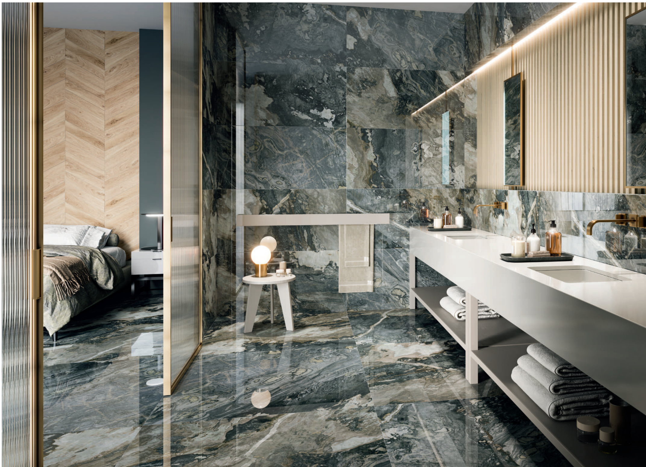
DEDALUS POLISH RECT. | 20X120 - 60X120