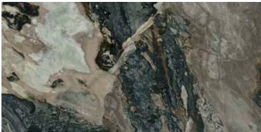
* DEDALUS POL RECT. 60X120 / 24"X48" P34/M