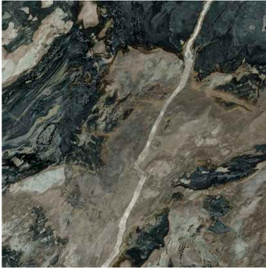
* DEDALUS POL RECT. 120X120 / 48"X48"