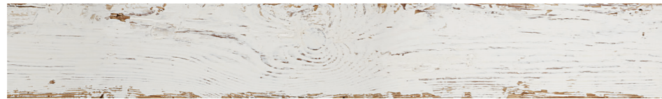
6000835 - SILO WOOD BIANCO 10X70 / 3,9"X27,5" 38