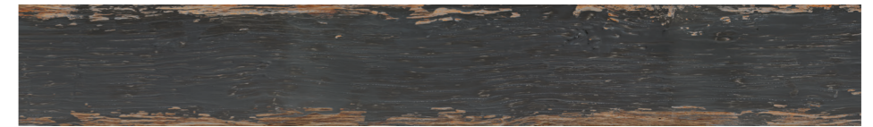
6000838 - SILO WOOD NERO 10X70 / 3,9"X27,5" 38