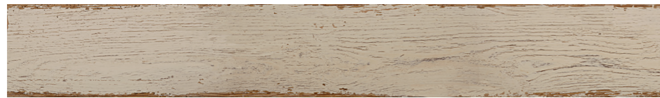
6000836 - SILO WOOD BEIGE 10X70 / 3,9"X27,5" 38