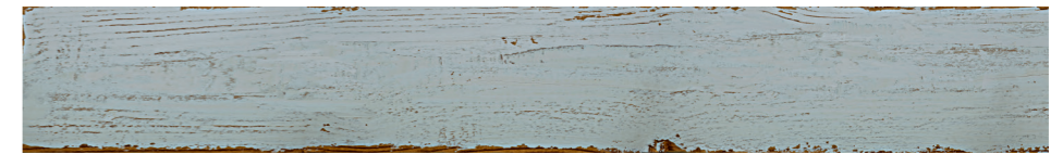
6000839 - SILO WOOD AZZURRO 10X70 / 3,9"X27,5" 38