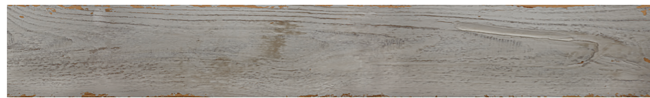
6000837 - SILO WOOD GRIGIO 10X70 / 3,9"X27,5" 38