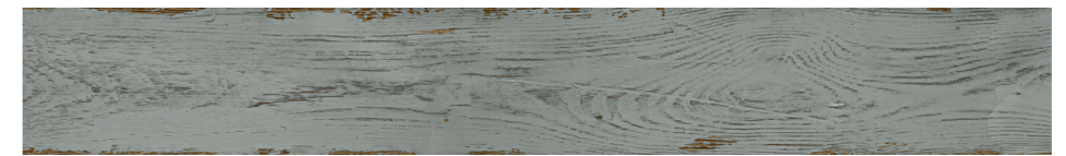
6000840 - SILO WOOD GRIGIO SCURO 10X70 / 3,9"X27,5" 38