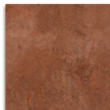
Alarcón Cuero Antideslizante G.130 G.130