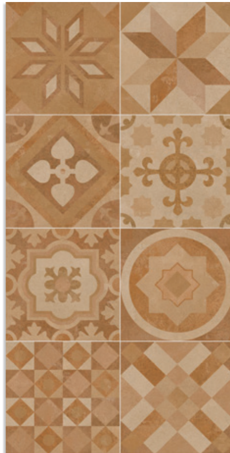
(1) Cambados Antideslizante G.140 G.140

(1) Este modelo está compuesto por diseños diferentes para combinar de modo alterno, se sirven en la misma caja. This model has different designs that are combined alternately, coming in the same box.