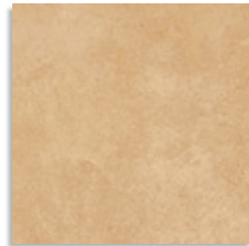
Alarcón Paja Antideslizante G.130 G.130