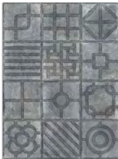
* Paulista Grafito G.179 Antideslizante G.179

* Este modelo esta compuesto por diseños diferentes para combinar de modo alterno, se sirven en la misma caja. This model has different designs that are combined alternately, coming in the same box.