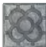
Acorn Grafito G.179 Antideslizante G.179