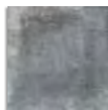
Orchard Grafito G.179 Antideslizante G.179