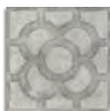
Acorn Cemento G.179 Antideslizante G.179