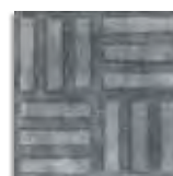
Norvins Grafito G.179 Antideslizante G.179