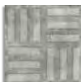
Norvins Cemento G.179 Antideslizante G.179