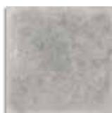
Orchard Cemento G.179 Antideslizante G.179