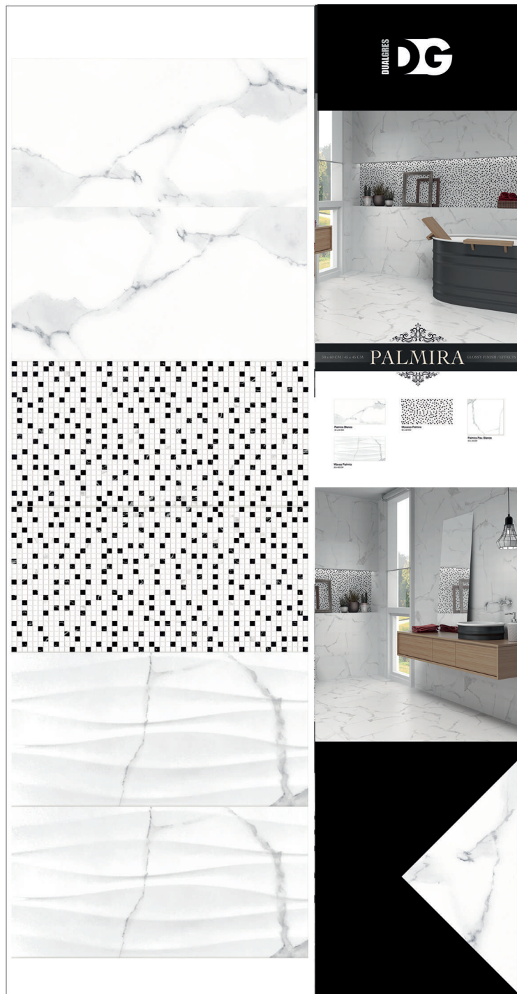
BEL17_010 · PANEL PALMIRA EURO