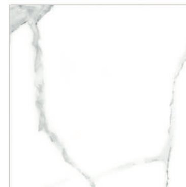
Palmira Pav. Blanco GT1 45 x 45 CM