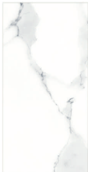
Palmira Blanco GT3 30 x 60 CM