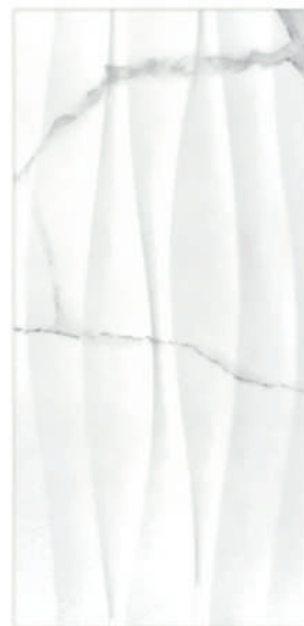
Waves Palmira GT4 30 x 60 CM