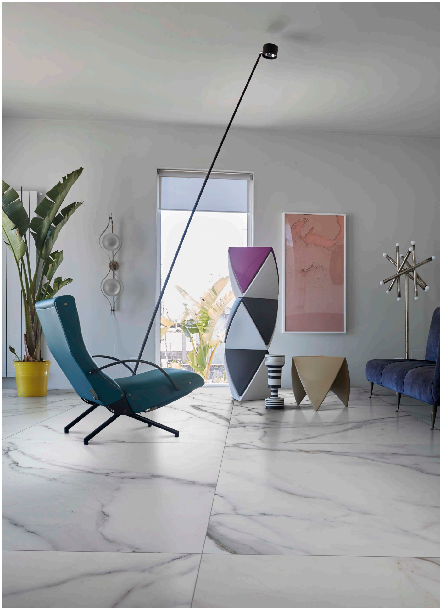
MF120120N METAFISICO NATURAL | 120x120 | 48"x48"