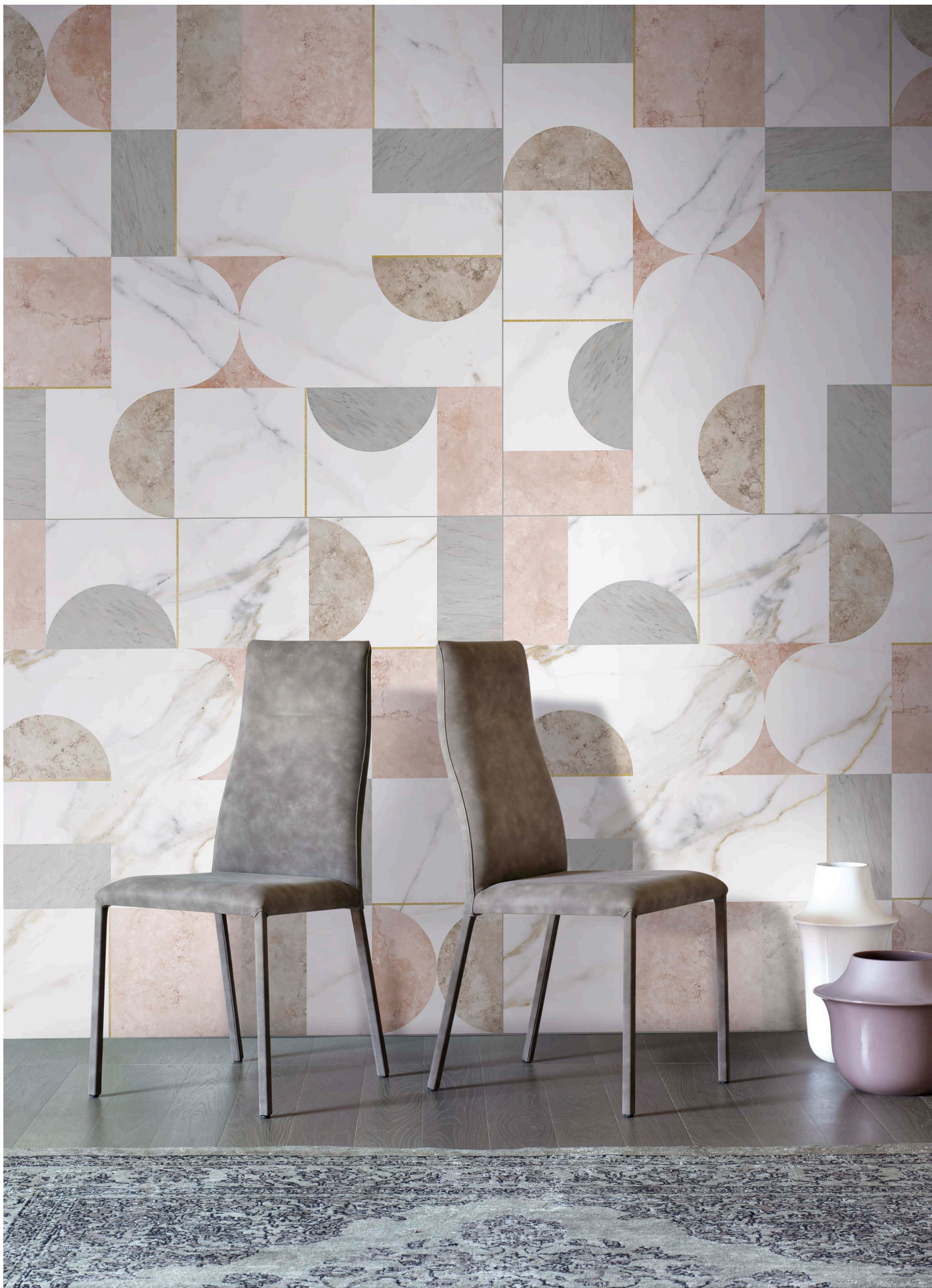
MF120120NT NATURAL TEXTURA | 120x120 | 48"x48"