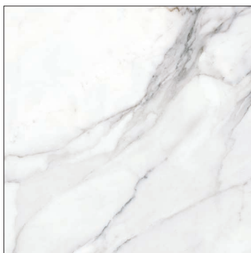
MF120120N METAFISICO NATURAL 120x120 | 48"x48"