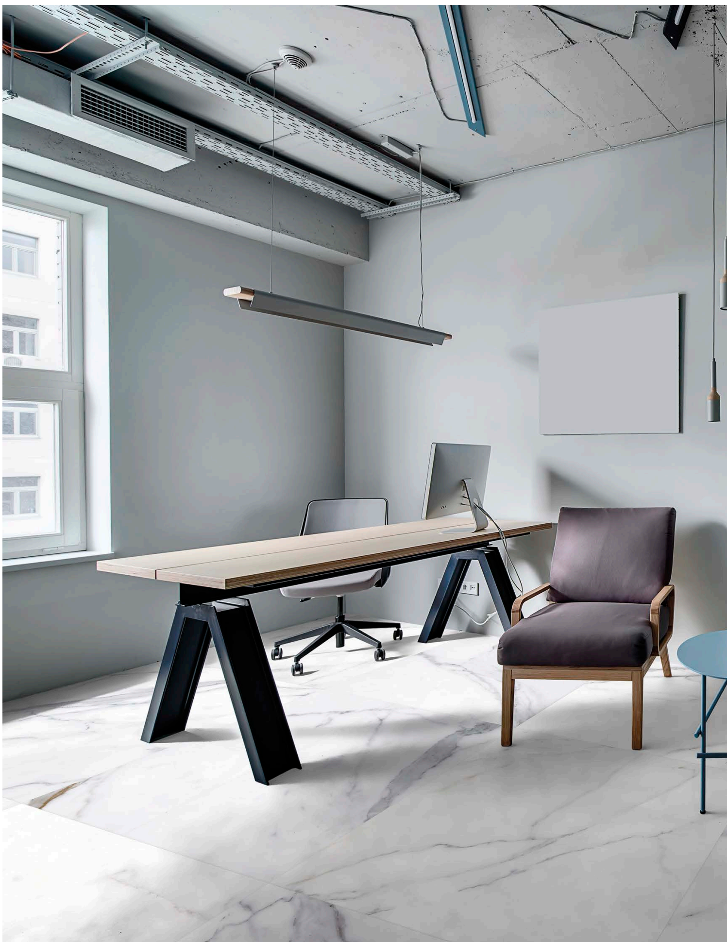
MF120120N METAFISICO NATURAL | 120x120 | 48"x48"