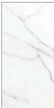
MF 60120P METAFISICO POLISHED 60x120 | 24"x48"