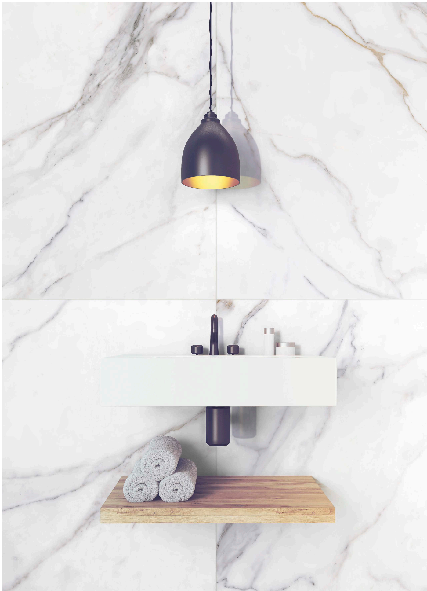
MF120120P METAFISICO POLISHED | 120x120 | 48"x48"