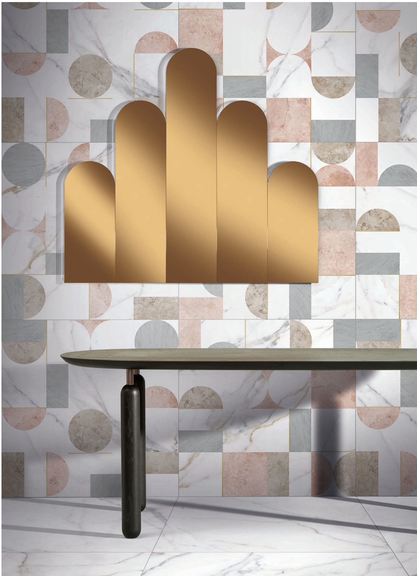
MF120120N METAFISICO NATURAL | MF120120NT NATURAL TEXTURA | 120x120 | 48"x48"