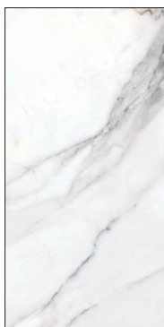
MF60120N METAFISICO NATURAL 60x120 | 24"x48"