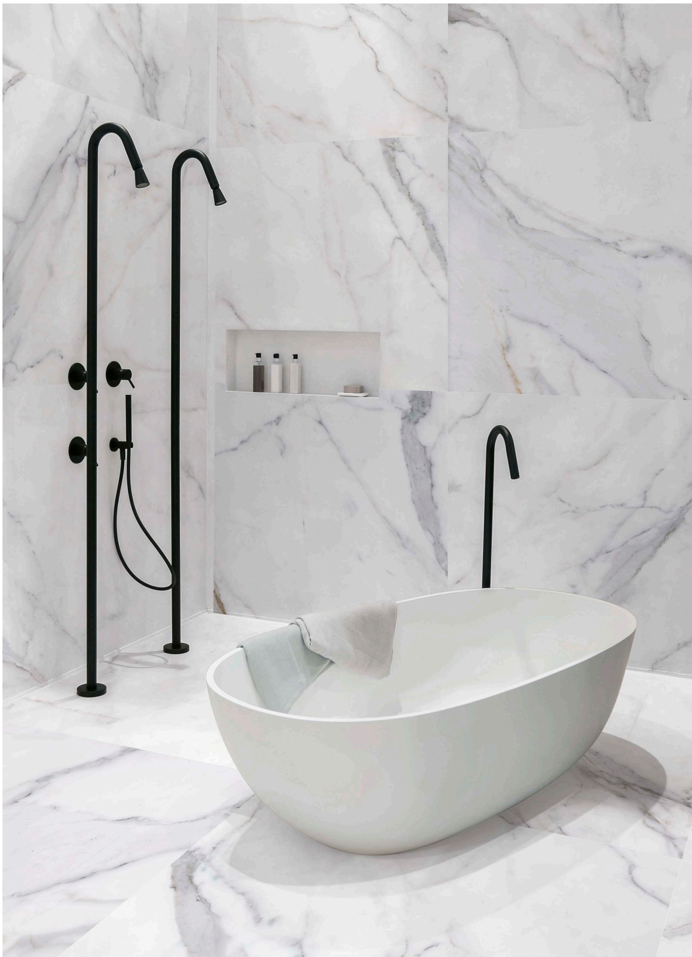
MF120120N METAFISICO NATURAL | 120x120 | 48"x48"