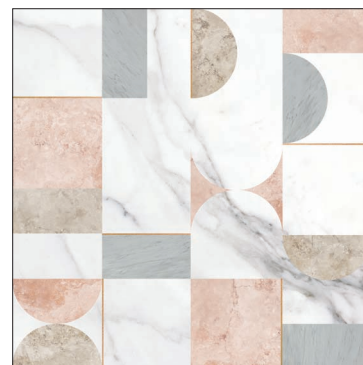
* 2 soggetti misti nella stessa scatola 2 mixed pattern in the box