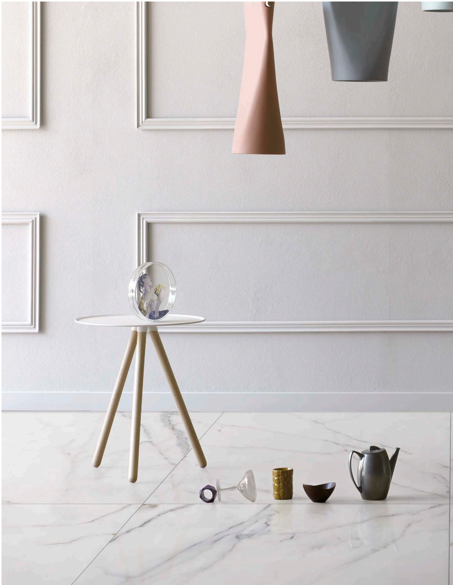
MF120120P METAFISICO POLISHED | 120x120 | 48"x48"