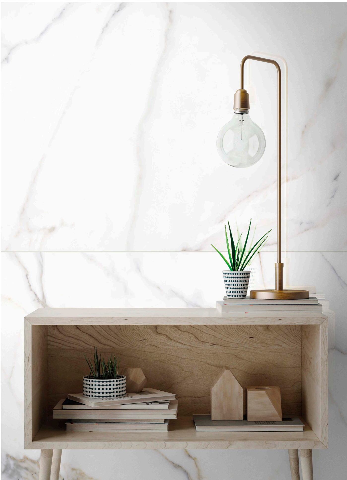
MF120120P METAFISICO POLISHED | 120x120 | 48"x48"