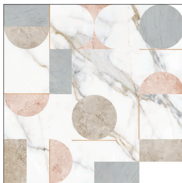
MF120120NT NATURAL TEXTURA 120x120 | 48"x48"