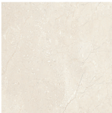
Pav. Arles 45 x 45 CM