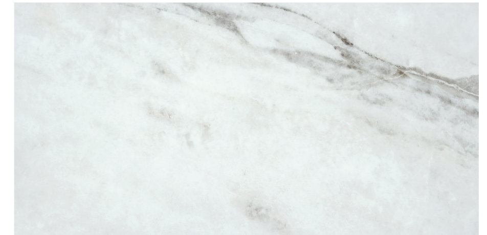
Piur White Sat G464R