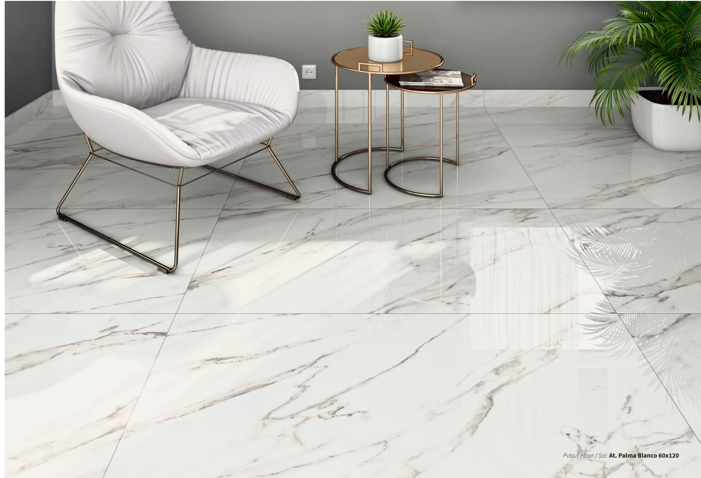
Pvto. / Floor / Sol: At. Palma Blanco 60x120