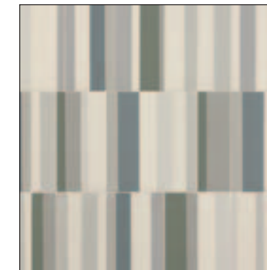
blanc bleu vert