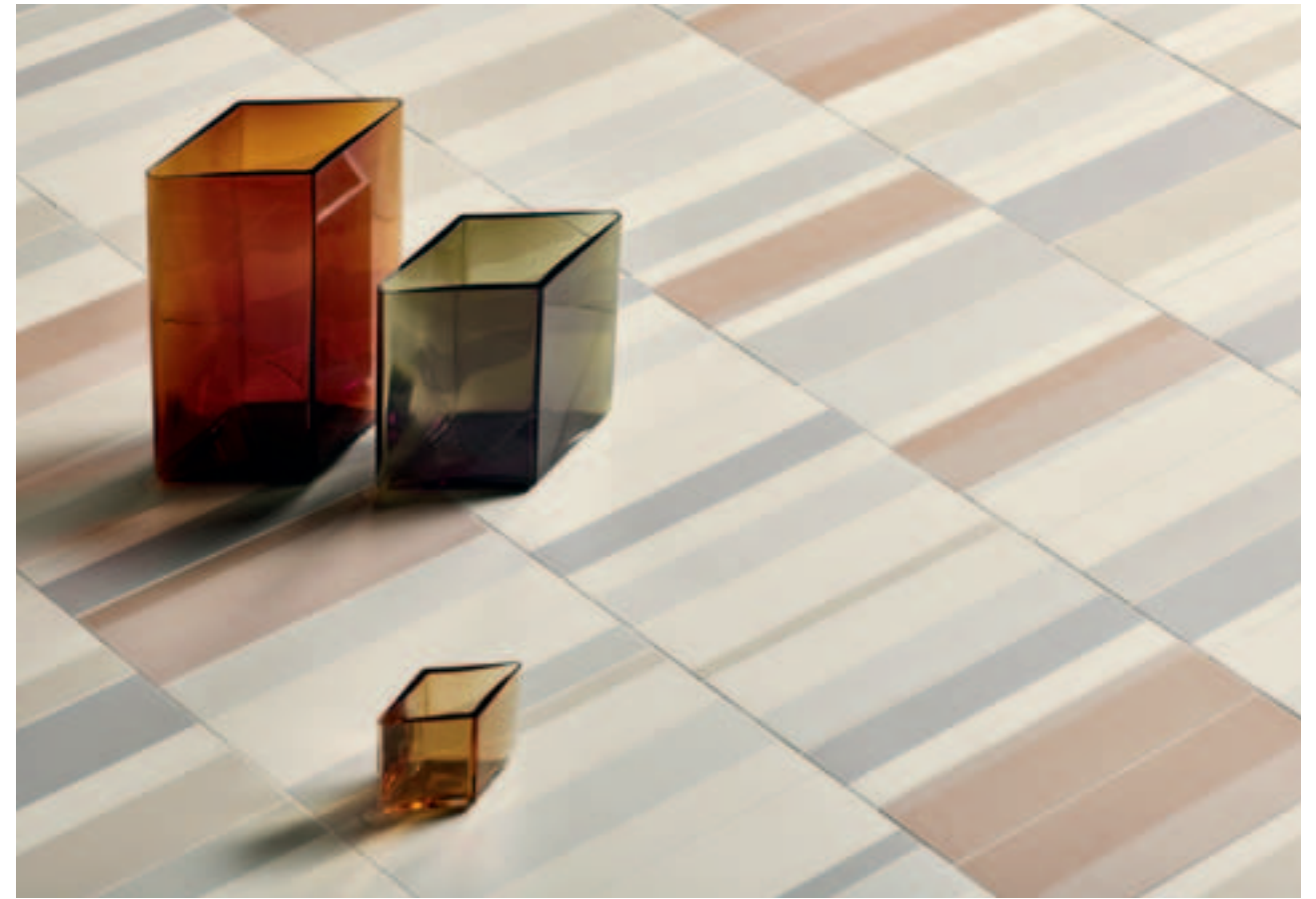
This page: Blanc Rose. Opposite page: Wall: Blanc, Floor: Blanc Rose.