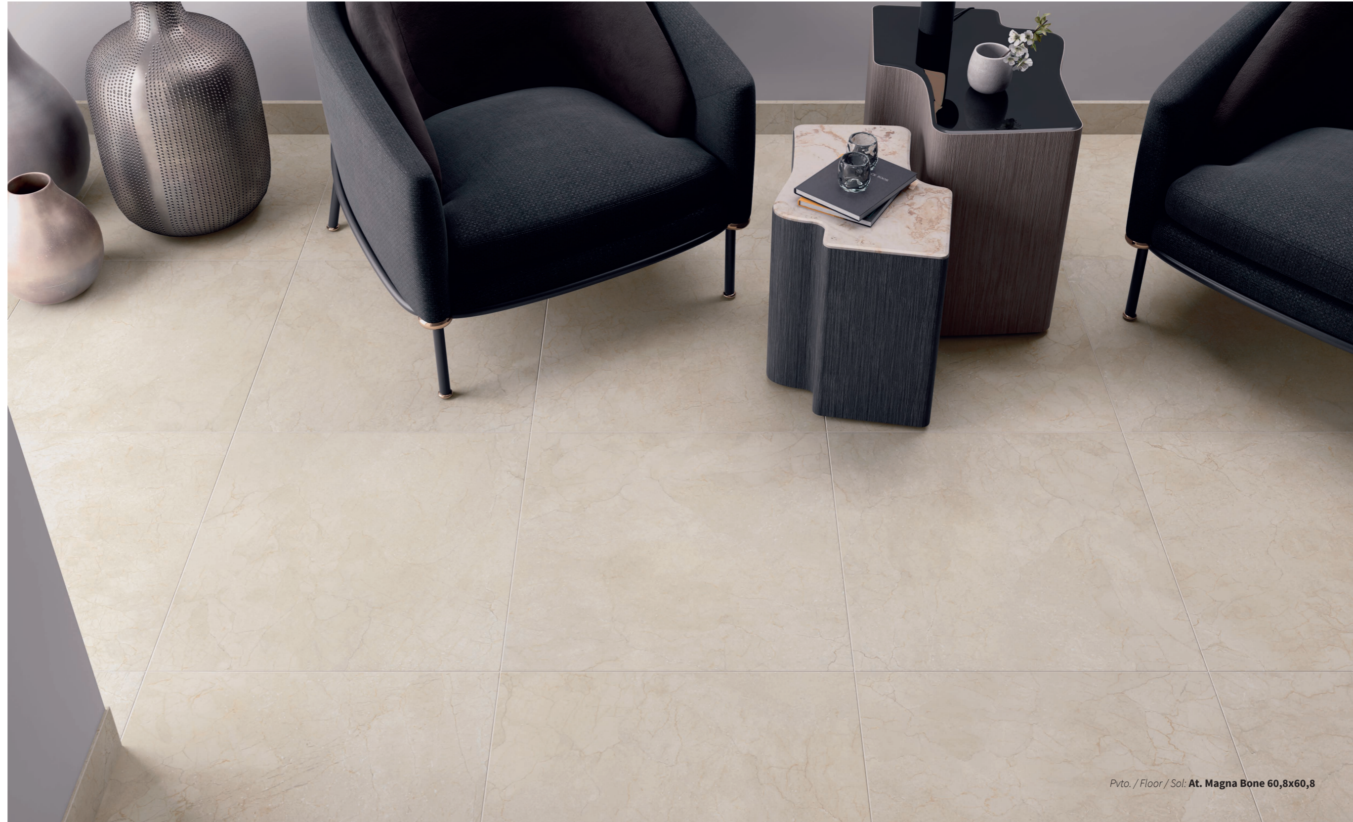
Pvto. / Floor / Sol: At. Magna Bone 60,8x60,8

● At. Magna Bone 60,8x60,8 M19 015.440.0413.03678