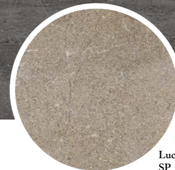
Lucca Beige SP_100*180