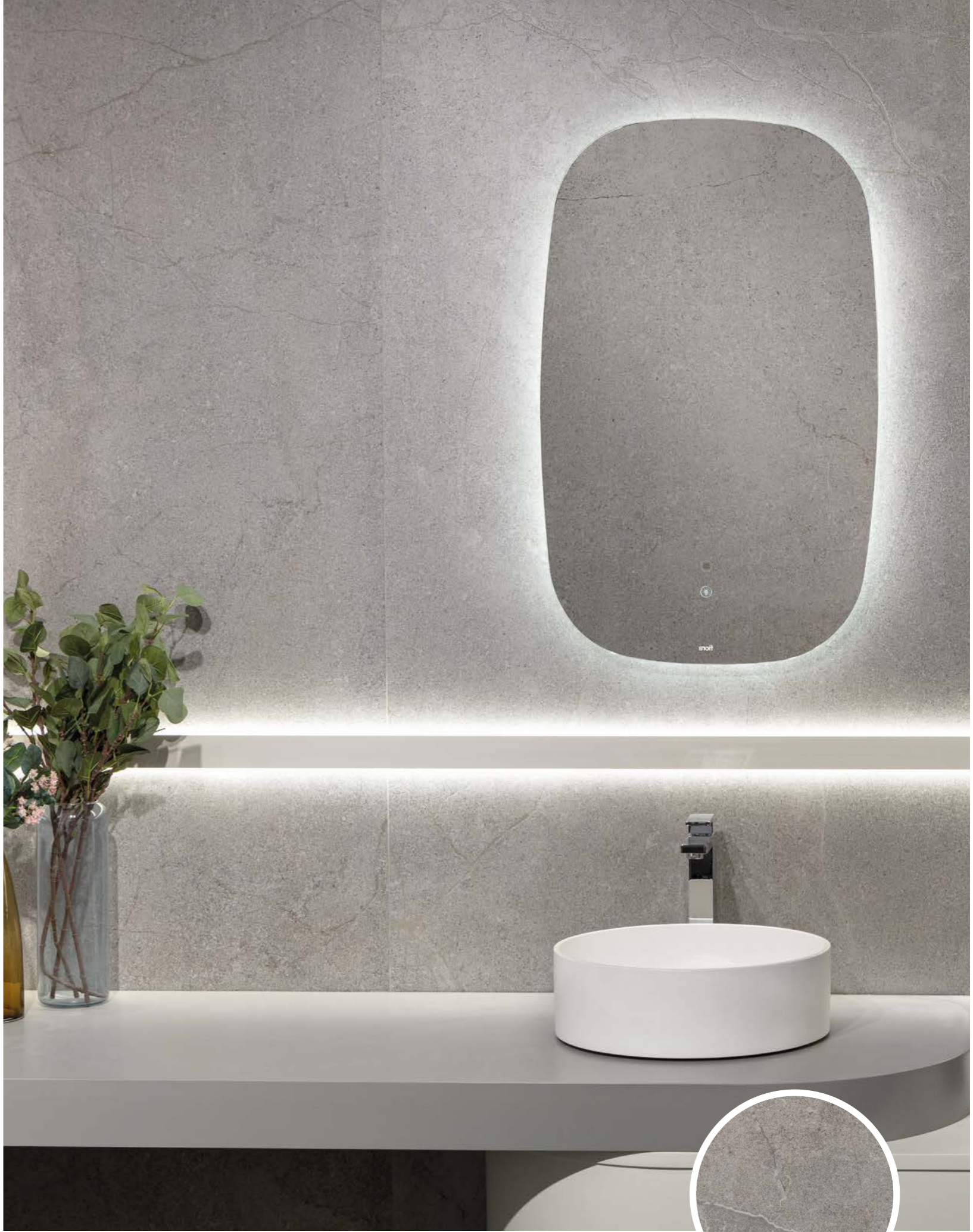
Lucca Grey SP_100*18