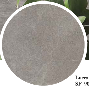
Lucca Grey SF_90*90