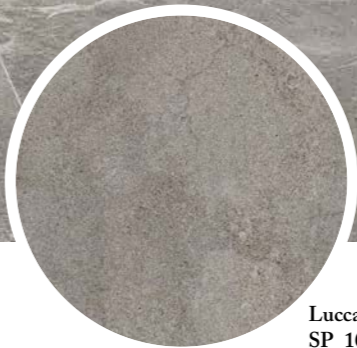
Lucca Grey SP_100*180