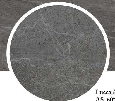
Lucca Anthracite AS_60*120