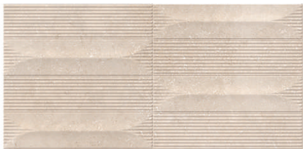
Neo Baiona 30 x 60 CM