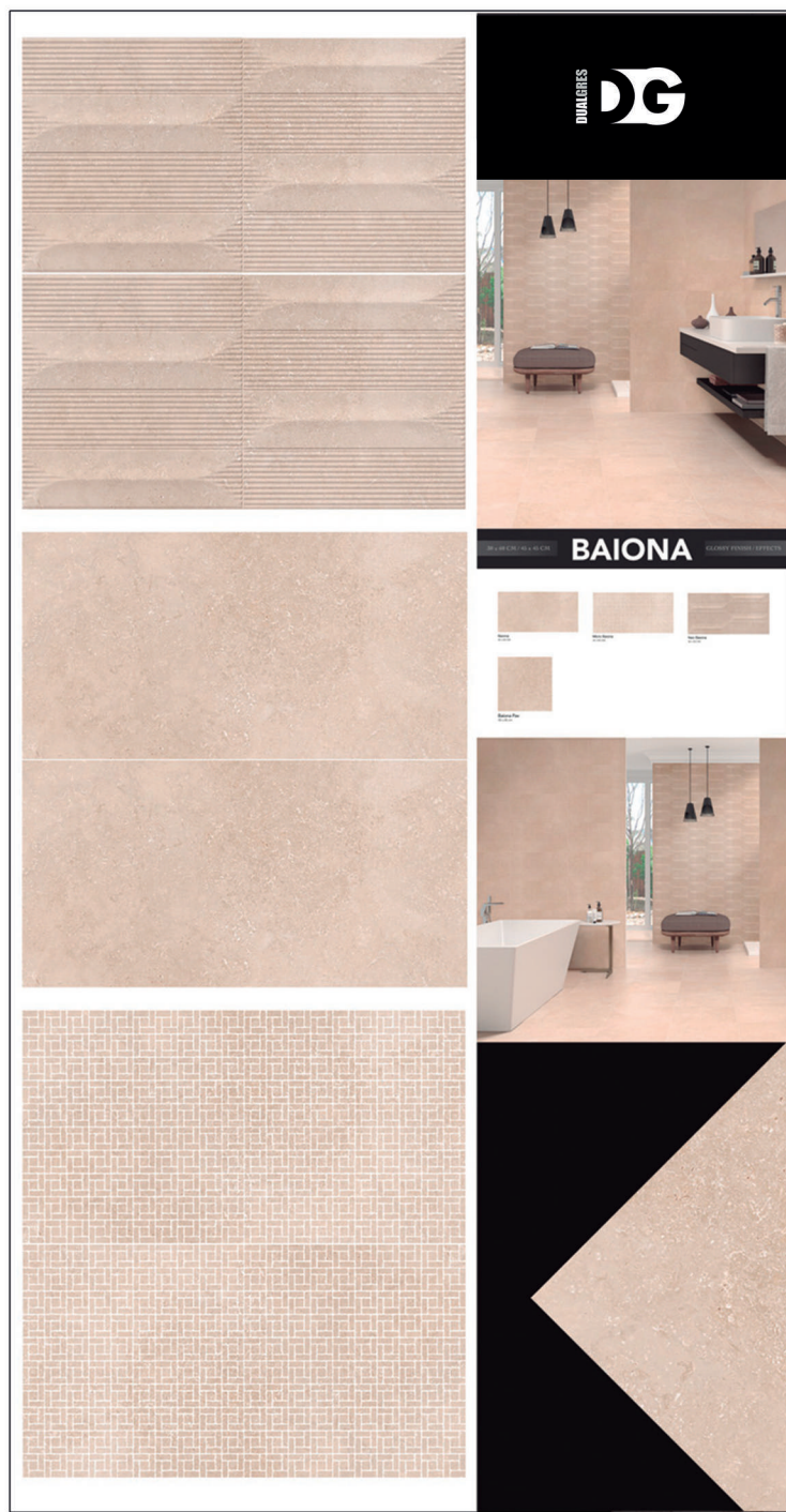
D19_005 · PANEL BAIONA EURO