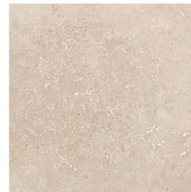
Pav. Baiona 45 X 45 CM