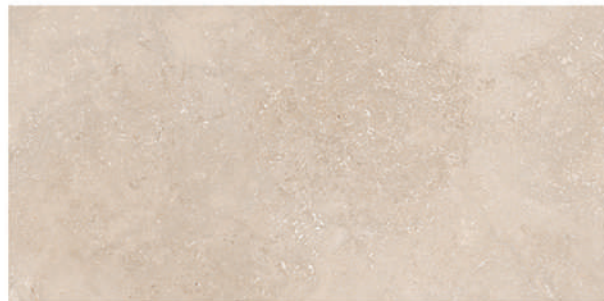
Baiona 30 x 60 CM