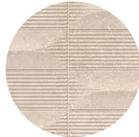
Detail Neo Baiona